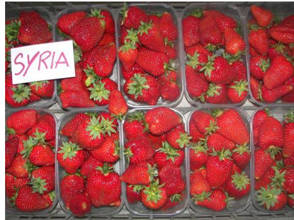
10. kép Syria R