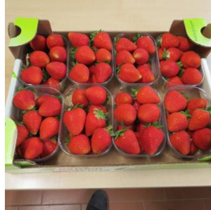
12. kép Scala R