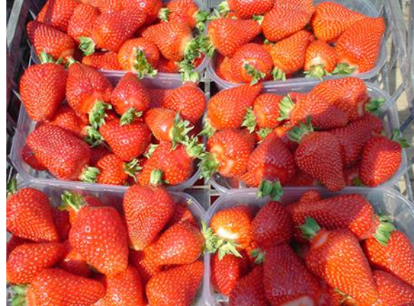
4. kép Asia R