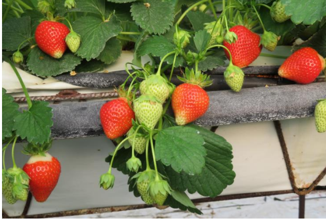
11. kép Scala R

Érzékenység: Gyökérbetegségekre nem, de lisztharmatra érzékeny a fajta. Ajánlott tavasszal és ősszel is lisztharmat ellen megelőző kezelést alkalmazni!