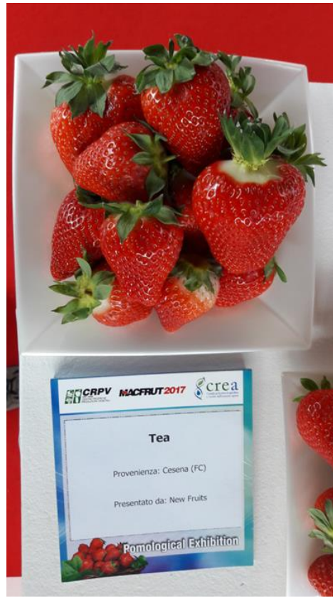
13.kép Tea R