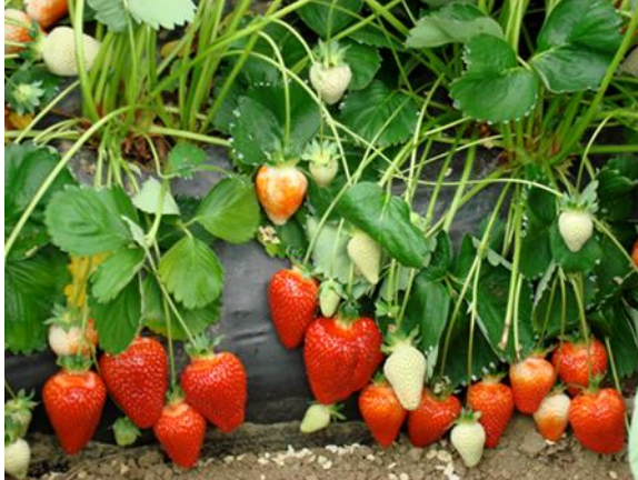
3. kép Asia R

Származási hely: Olaszország. Érés ideje középkorai, Darselect-hez hasonló. Hozama nagy - nagyon nagy. Gyümölcs jellemzők: világos, fényes piros színű, kúpos, kiemelkedő hússzilárdságú, bogyoí nagyon nagy méretűek, egyöntetűek, nagyon mutatósak. Eltarthatósága jó, minden értékesítési formának megfelel. Bokra: robosztus. Termesztése: fóliában és talaj nélküli termesztésre (pl. Grodan) és szabadföldön is. Lisztharmatra és Colletotrichumra kissé, gyökérbetegségekre viszont nem érzékeny.