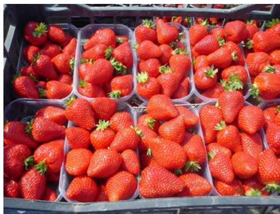
2. kép Alba R