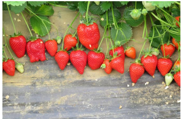
7. kép Olympia R