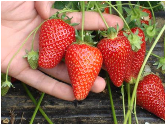
9. kép Syria R

Gyümölcse középnagy- nagy, attraktív, kúpos. Színanyagban gazdag, élénk piros. Kiváló ízű, édes fajta, C-vitaminban gazdag. Jól bírja a manipulációt és a mélyhűtést is! Érése az Albát követően 6 nappal kezdődik. Szabadföldi termesztésre ajánlott fajta, mely akár két évig is termesztésben tartható. A kontinentális klímát jól tűri. (Pl. Magyarország) Fő erényei: esőálló, nem rothadékonny fajta, kiváló gyümölcshízéssel és jó tárolhatósággal, ipari feldolgozhatósággal (fagyasztás, püré, jam). Esetleges hibái: baktériumokra kissé érzékeny, gyümölcseinek színe túléretten sötétpiros.