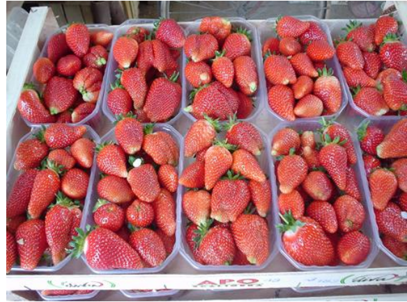
5. kép Roxana R