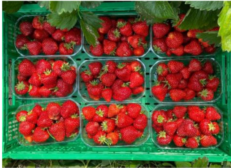
Corita ® G1455