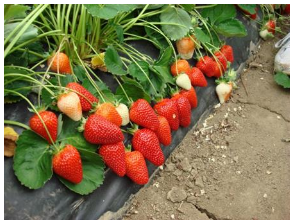
1.kép Alba R

Jó eredményeket ad mind fóliában, mind szabadföldön!